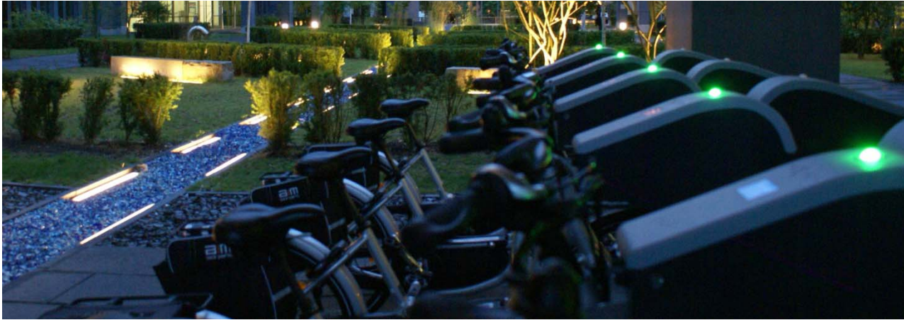
Cabinet d'avocats (Lux)