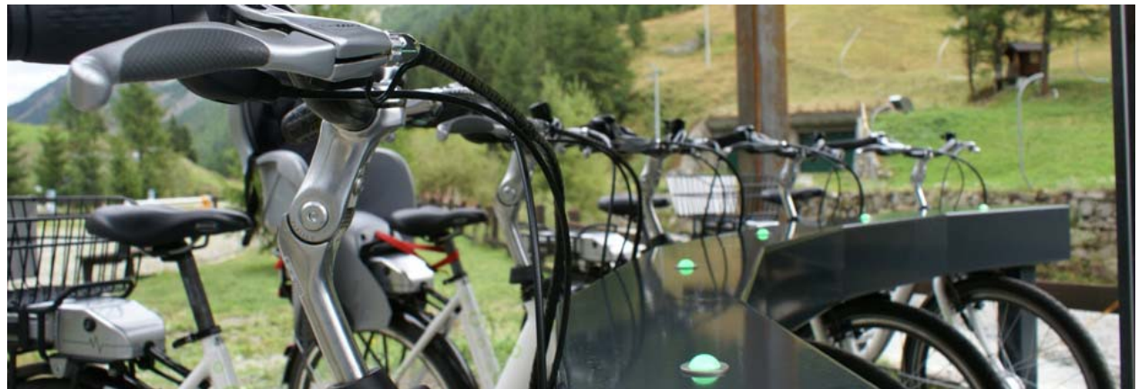
Parc national du Grand Paradis (It)