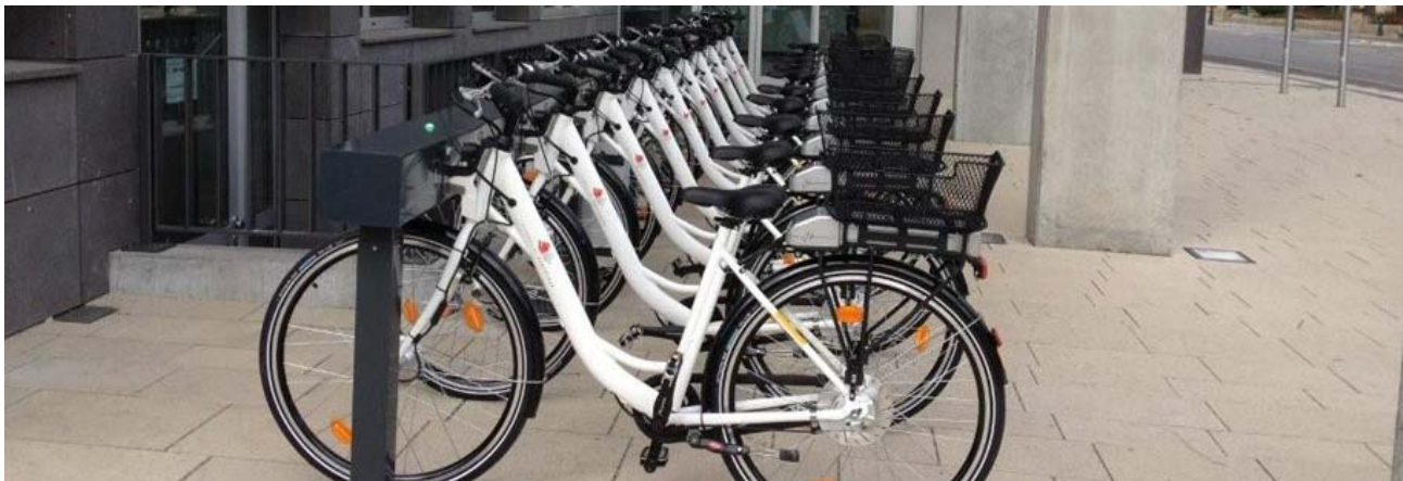
Commune de Bertrange (Lux)